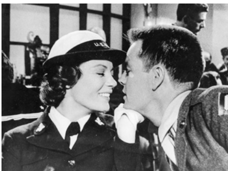
1958 LE TEMPS DE LA PEUR (In Love and War) de Philip Dunne avec Robert Wagner