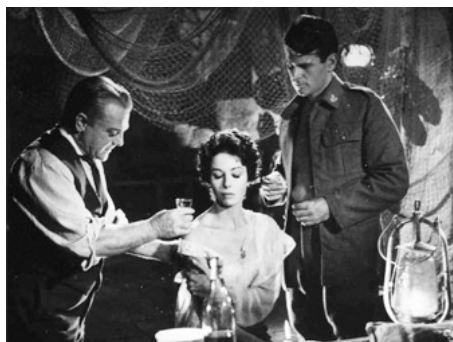
1958 L'ÉPOPÉE DANS L'OMBRE (Shake hands with the Devils) de M. Anderson avec J. Cagney, Don Murray