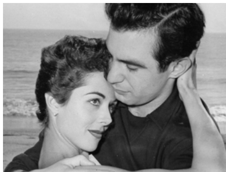
1958 CŒUR VIOLENT (The violent Heart) de John Frankenheimer avec Ben Gazzara