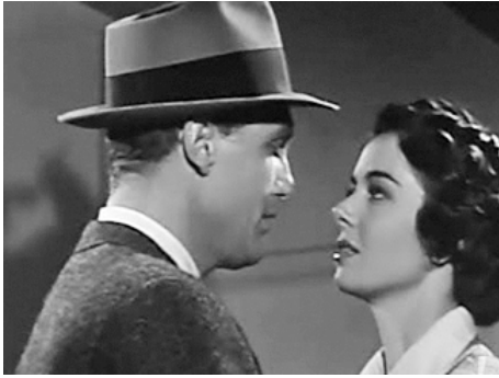
1955 LAURA (A Portrait of Murder) de John Brahm avec Robert Stack