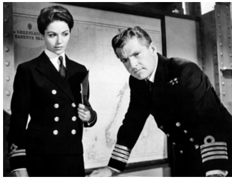
1959 COULEZ LE BISMARCK (Sink the Bismarck !) de Lewis Gilbert avec Kenneth More