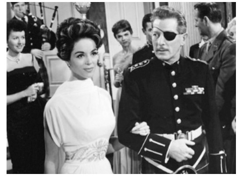
1960 LA DOUBLURE DU GÉNÉRAL (On the Double) de Melville Shavelson avec Danny Kaye