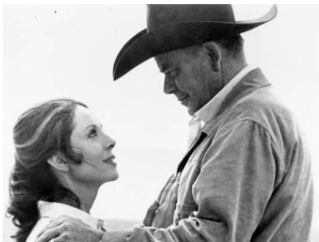
1972 LES TROIS FLÈCHES (Santee) de Gary Nelson avec Glenn Ford