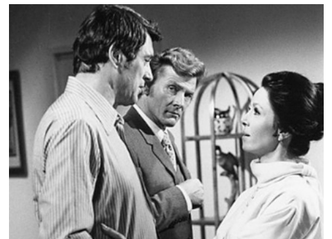
1974 L'HOMME SANS VISAGE (The Man without a Face) de Lee H. Katzin avec Rock Hudson, Steve Forrest