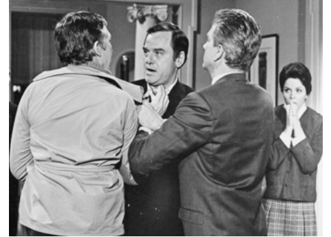
1968 COMPANIONS IN NIGHTMARE de Norman Lloyd avec Patrick O'Neal, Gig Young