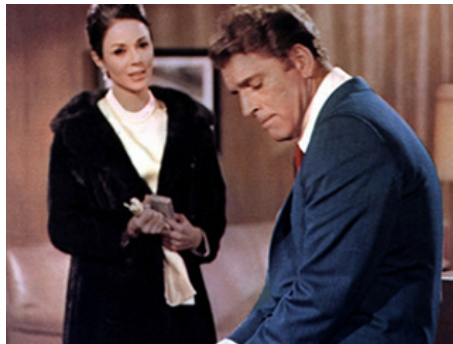
1969 AIRPORT (Airport) de George Seaton avec Burt Lancaster