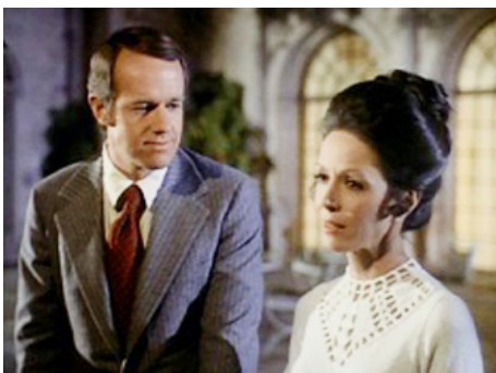
1974 THE QUESTOR TAPES de Richard A. Colla avec Robert Foxworth