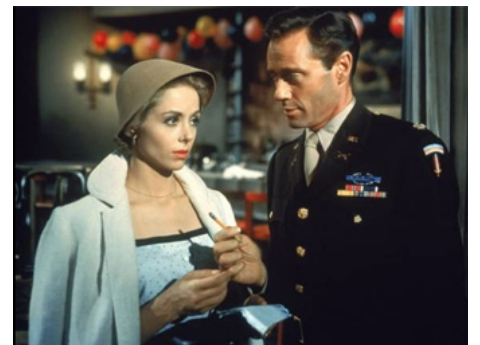
1958 TONNERRE SUR BERLIN (Fraulein) d'Henry Koster avec Mel Ferrer