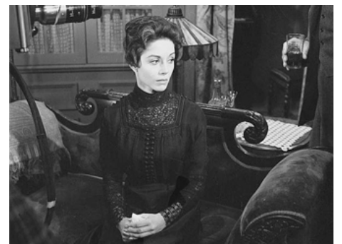
1959 LES AILES DE LA COLOMBE (The Wings of the Dove) de Robert Stevens