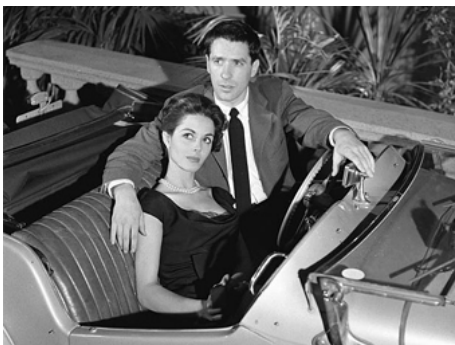
1957 RÊVES D'HIVER (Winter Dreams) de John Frankenheimer avec John Cassavetes