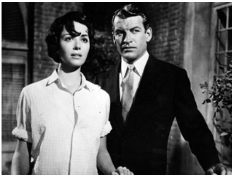
1955 LE TRAIN DU DERNIER RETOUR (The View from Pompey's head) de Ph. Dunne avec Richard Egan