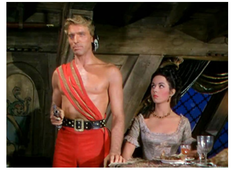
1952 LE CORSAIRE ROUGE (The Crimson Pirate) de Robert Siodmak avec Burt Lancaster