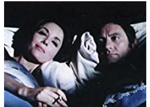
1970 TRIANGLE (Triangle) de José Bénazéraf avec Ray Danton