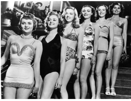
1951 LADY GODIVA (Lady Godiva rides again) de Frank Launder avec Diana Dors, Joan Collins