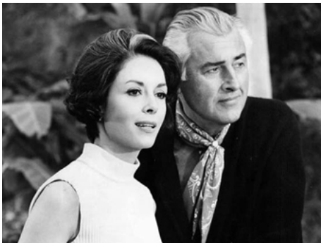
1969 ANY SECOND NOW de Gene Levitt avec Stewart Granger