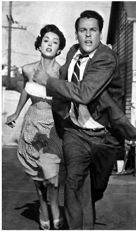
1955 L'INVASION DES PROFANATEURS DE SÉPULTURES (Body Snatchers) de Don Siegel avec Kevin McCarthy