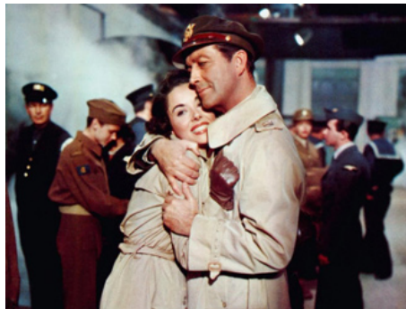
1956 AU SIXIÈME JOUR (D-Day the sixth of June) d'Henry Koster avec Robert Taylor