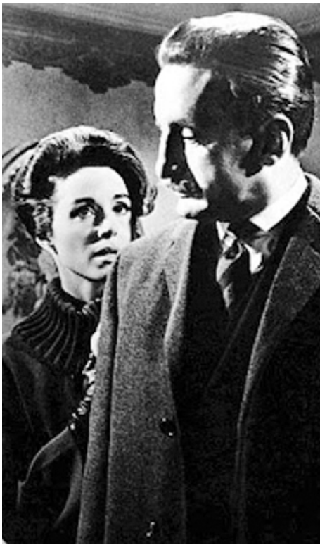
1963 LE DERNIER DE LA LISTE (The List of Adrian Messenger) de John Huston avec George C. Scott