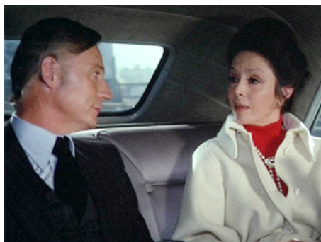
1975 LE SAUVAGE de Jean-Paul Rappeneau avec Gabriel Cattand