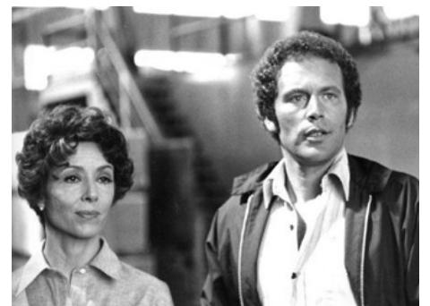
1980 M STATION, HAWAÏ (M Station, Hawaii) de Jack Lord avec Jared Martin